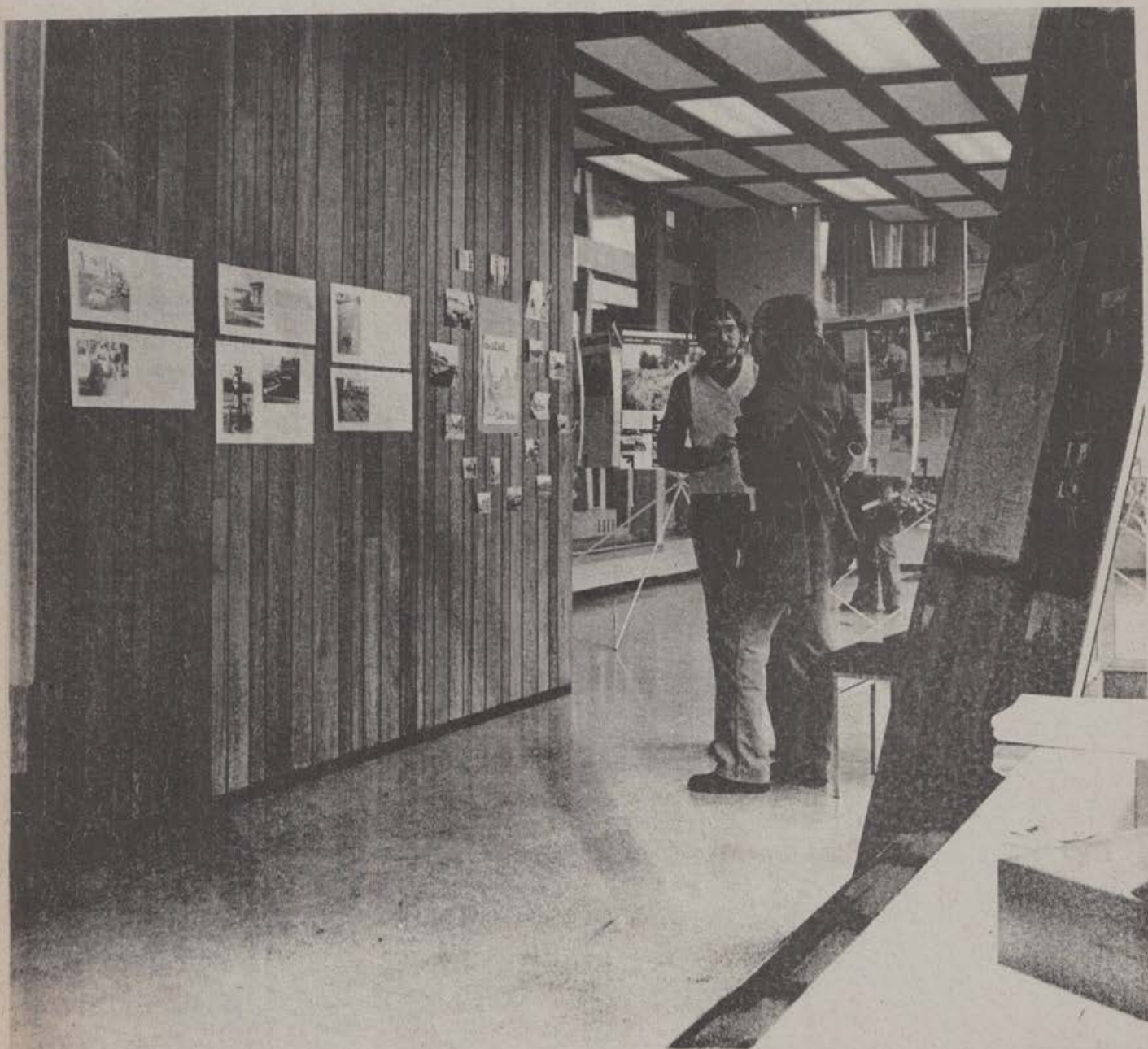
Detailfoto uit de tentoonstelling "Wijs op Weg" in het Stationsgebouw.