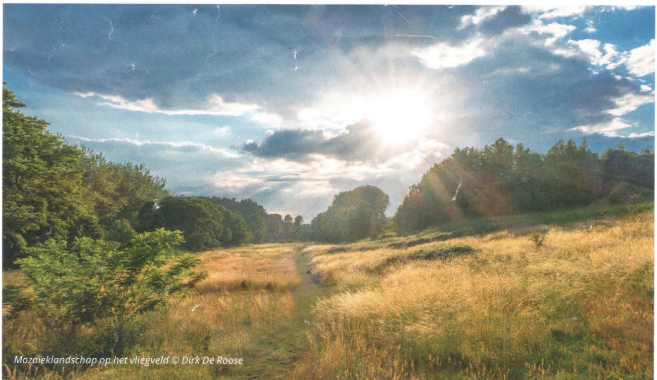
Mozaïeklandschap op het vliegveld

Je bevindt je nu in het Gelaagpark. Ook hier liggen oude kleiputten, die mooie natuur zijn geworden, onder andere heel rijk aan paddenstoelen. Blijf 'Steendorp wandelroute' volgen. Als je centraal in het Gelaagpark staat, zie je de restanten van een 'luzze': een overdekte droogplaats voor bakstenen. Ze dateert niet uit de tijd van de kleiwinning, maar werd als monumentje zo'n tien jaar geleden door de gemeente opgetrokken. Vandalen vonden het helaas een leuk speeltuig. Ga rechtdoor onder de luzze, tussen twee vijvers door. Het pad draait achter de vijvers naar rechts. Volg het verder, je kunt trouwens niet anders. Als je net voorbij de vijver op een T komt, klim dan links terug uit de kleiput. Boven ga je door de houten afsluiting. Ga onmiddellijk uiterst rechts en